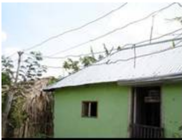
Figura 5. Cables con riesgo de contacto en Villa Katy- Sincelejo

Los riesgos y la ocurrencia de accidentes son numerosos por la existencia de postes en un estado defectuoso, cables de diferentes calibres y tipologías, a veces quemados o pelados, etcétera. En ocasiones se produce la muerte y se lesiona la salud de los habitantes: