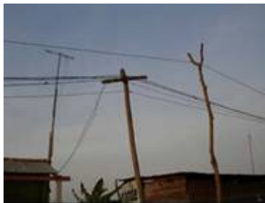
Figura 6. Postes eléctricos de fabricación propia en Villacielo – Montería